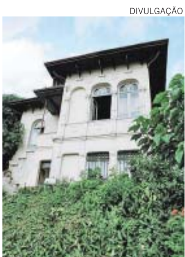
1912 - À espera de restauração