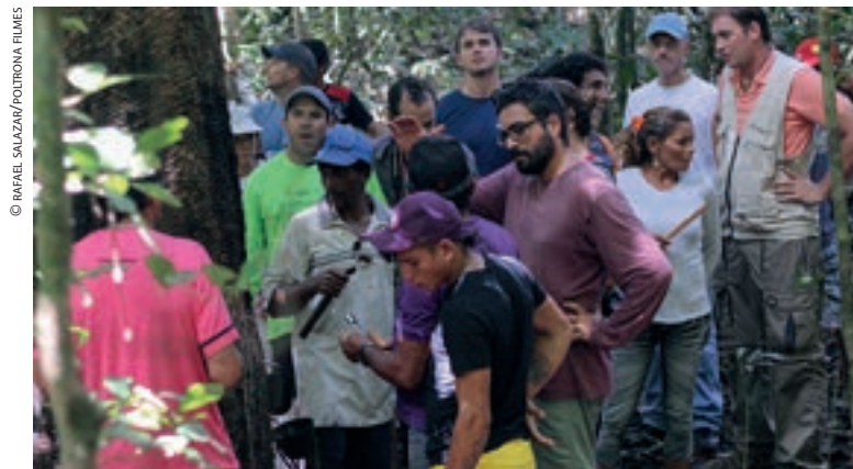
Intercâmbio técnico abordou o corte da seringa entre outros temas