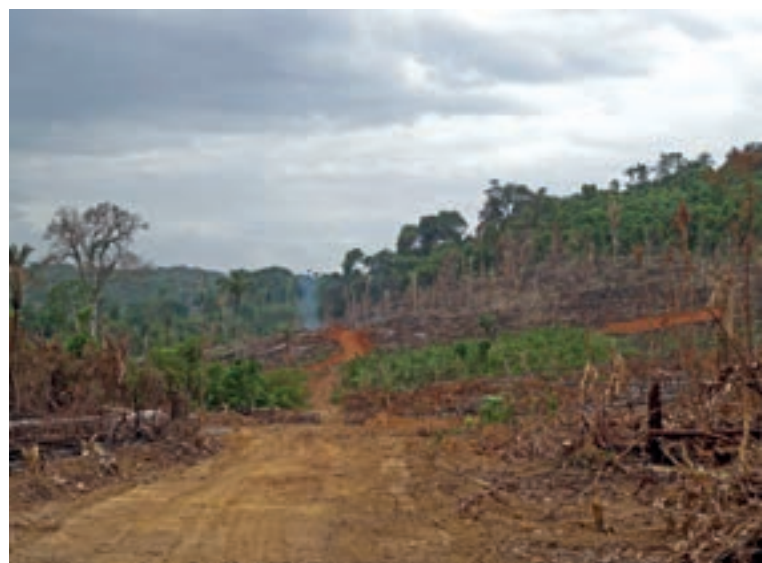
Estrada vicinal se expande a oeste da península

depois para a Floresta Nacional de Roraima (Flona) porque na expedição de setembro do ano passado uma ocupação de pelo menos 30 hectares foi encontrada no limite da TIY com a Flona, cuja origem parecia relacionada a possíveis estradas que atravessariam a Unidade de Conservação. As equipes identificaram três vicinais na imagem satélite e com a ajuda do GPS visitaram uma a uma. Nenhuma delas chega a invadir a Flona.