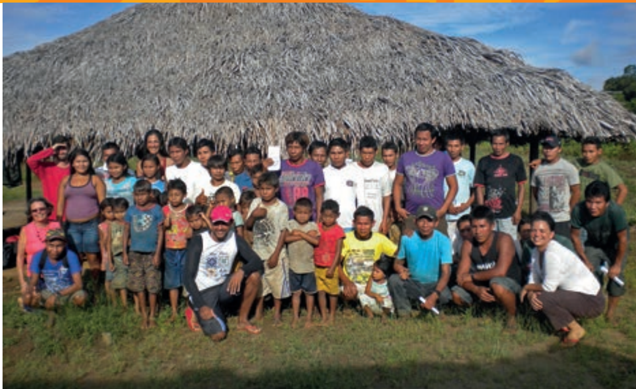
Representantes dos Hupd'äh e Yuhupdeh participam do seminário local em Santa Cruz do Cabari